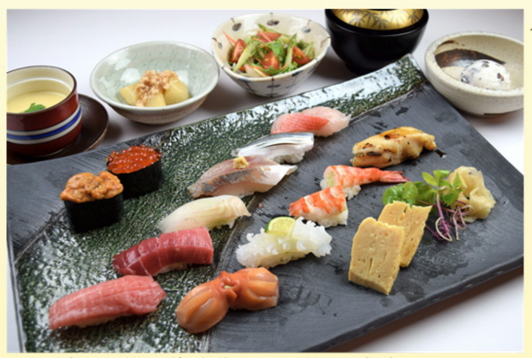
サラダ・お椀・デザート Salad,miso soup,dessert