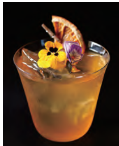
Amber Grace アンバーグレース

Last Elysium Gin, Grand Marnier, Lemon Juice, Agave Syrup, Champagne ラストエリジウムジン、グランマルニエ、 レモンジュース、アガベシロップ、シャンパン