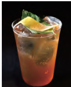
The Gilded Garden ザ・ギルディッド ガーデン

Last Elysium Gin, Clear Orange, Orange Bitter, Earl Grey Tea, Earl Grey Syrup, Lemon Juice ラストエリジウムジン、クリアオレンジジュース、 オレンジピター、アールグレイティー、アールグレイシロップ、 レモンジュース