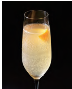
Elysian Fizz エリジアンフィズ

Last Elysium Gin, Grand Marnier, Lemon Juice, Agave Syrup, Champagne ラストエリジウムジン、グランマルニエ、 レモンジュース、アガベシロップ、シャンパン