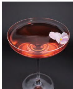
Sweet Bitter Symphony

ヘンドリックスジン、ヒプノティックリキュール、 キューカンバーシロップ、キューカンバージュース、 レモンジュース、ソーダ