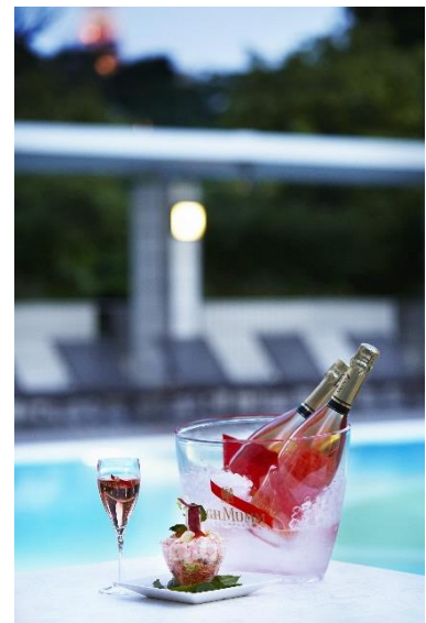
シャンパン&グルメセット(イメージ)

また、併設の飲食コーナー「プールサイドスナック」では、マムのシャンパンをはじめ、ワインやフローズンカクテル、スムージーなど、個性的で洒落なドリンクを楽しむことができます。フードメニューは、「小海老のオーロラソース」や「ロブスターロール」、「ピッツァ ピンクアイランド」、かき氷、ブラウニーなど、マム グラン コルドンの味わいがより引き立つ特製メニューを豊富にとり揃え、「プールサイドスナック」コーナーほか、プールサイドでもお召し上がりいただけるメニューをご用意します。【メニュー例は3頁に記載】