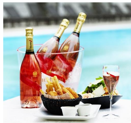
シャンパン&グルメセット(イメージ)