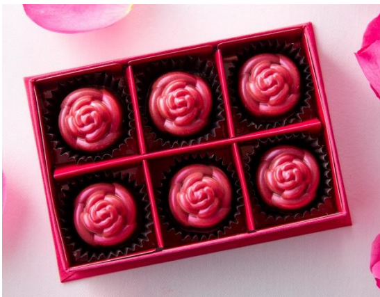
「ピアジェ ローズ・ルビーチョコレートボックス」6個入り

「ピエール・ガニエール パン・エ・ガトー」では、「ピアジェ ローズ」をイメージしたバラの形のチョコレートが6個入った「ピアジェ ローズ・ルビーチョコレートボックス」を主力商品として販売します。「ピアジェ ローズ」チョコレートは、第4のチョコレートとして話題のルビーチョコレートの中に、ラズベリーとバラのパート・ド・フリュイ(フルーツピューレのゼリー)が入ったボンボンショコラで、表面に柔らかな光沢があらわれています。ルビーチョコレートとラズベリーの軽やかな酸味とバラの香りが口の中に広がり、「ピアジェ ローズ」の甘美で幸福感に包まれた世界観を感じることでできる逸品です。そのほかに、「ピアジェ ローズ」チョコレートに加え、唇形のルビーチョコレート「リップ」やミルクチョコレートの中でパッションフルーツの酸味とフルーティーな香りが弾けるハート形の「パッション」、ベルガモットやグレープフルーツが香る丸形のボンボンショコラなどが入った詰め合わせ「ピアジェ ローズ・ルビーチョコレートアソート」(6個入り/12個入り)もご用意します。なお、チョコレート商品は、ホワイトデーのギフトとしてもお使いいただけるよう、3月14日(木)まで販売します。