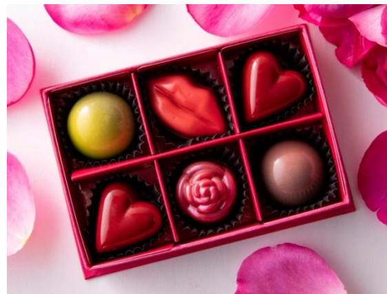
「ピアジェ ローズ・ルビーチョコレートアソート」6個入り

また、レストラン「ピエール・ガニエール」では、バレンタイン期間中のランチとディナーのコースのデザートとして、「ピアジェ ローズ」をイメージしたデザート「フルール・ド・ルビー」(Fleur de Ruby、仏語で「ルビーの花」の意味)を提供します。「フルール・ド・ルビー」は、ビスケット生地とルビーチョコレートのクリーム、フランボワーズのコンフィを重ねたケーキをルビーチョコレートのムースで包み込んでいます。お皿の上に咲く真紅のバラは、「ピアジェ ローズ」の持つ優雅さと華やかさを表現し、ルビーチョコレートならではの繊細でフルーティーな味わいを楽しむことができます。