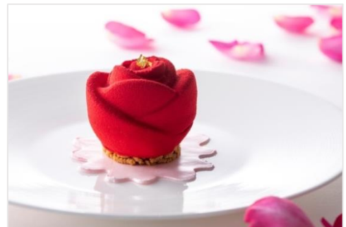
レストラン「ピエール・ガニエール」でデザートとして提供する 「フルール・ド・ルビー」