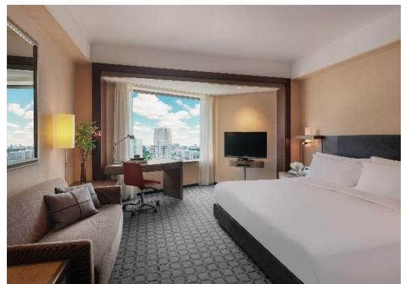
クラシックルーム(ダブル)