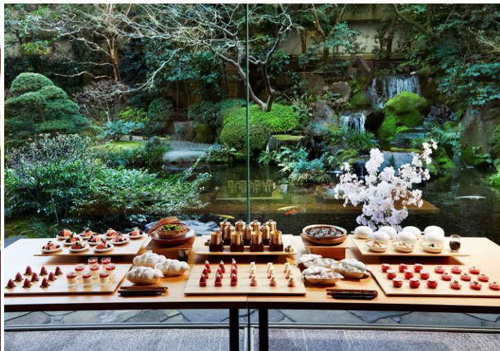
和スイーツbuffet(イメージ)