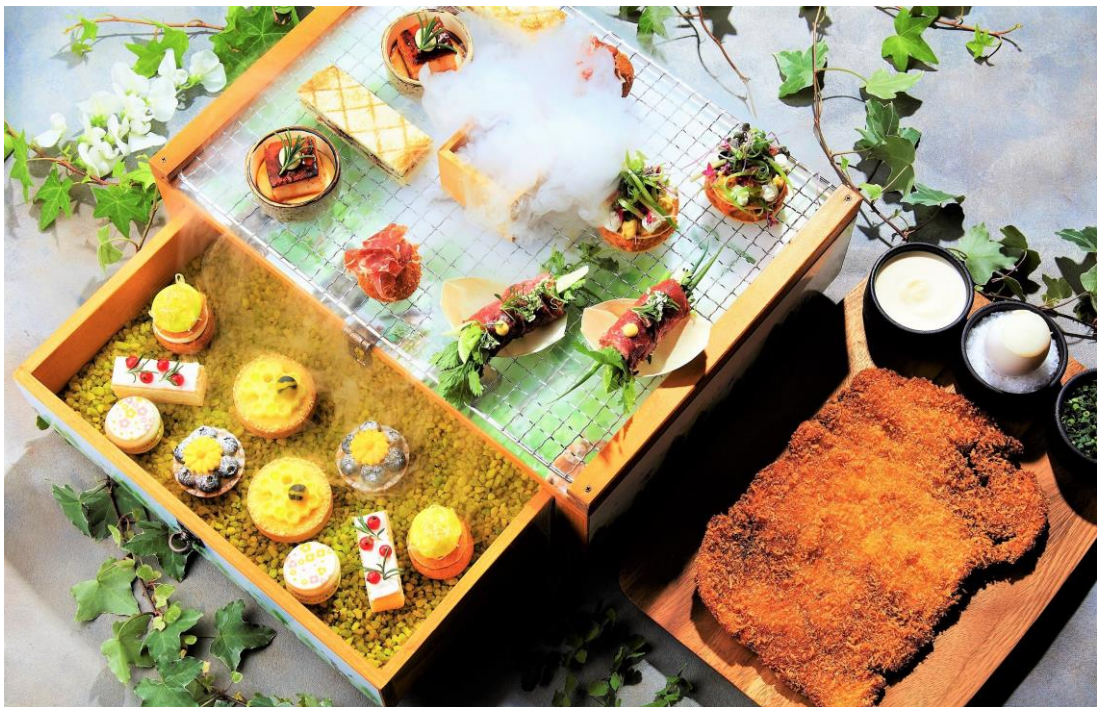
「フォレスト・ブースト」(写真は2名盛)

ランチや午後のくつろぎのひとつときに、自然豊かな野山に踏み入れピクニックを楽しむような感覚を味わうことができる「フォレスト・ブースト」の概要は次頁のとおりです。