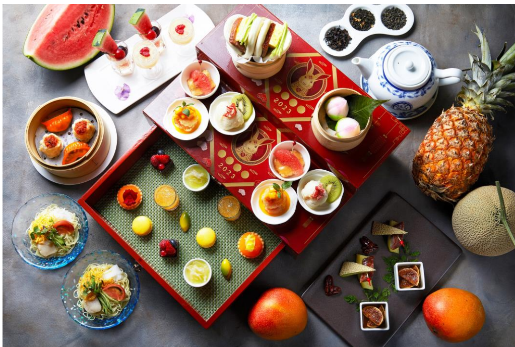
「サマーフルーツ・チャイニーズ・アフタヌーンティー」(写真は 2 名盛)

今年の夏の新メニューは、旬の食材を使用した自家製点心 10 品と、種類豊富なフルーツを用いたスイーツ 8 品を、干支のうさぎを描いた特製ボックスにセットして提供し、各種中国茶とともに存分にお楽しみいただけます。果物の甘味や酸味とともに魚の旨味を引き出した「カジキのエスニックオレンジソース グレープフルーツ添え」「海老のマンゴーマヨネーズソース」や、肉料理にもそれぞれ相性の良い果物を合わせた「鴨肉のローストとパイナップル」「もち豚チャーシューとメロン」などを揃えます。一つ一つ皮から手作りする「花梨」自慢の「ニラと海老入り蒸し餃子」「桃饅頭」、暑い夏には欠かせない「帆立貝とイカ入り冷やしそば 醤油ダレ」なども含め、夏の彩り満載の内容でおとどけます。また、スイーツメニューも、「桃のタピオカミルク」「マンダリンオレンジとライムのゼリー」「レモンとパッションフルーツマカロン」など、それぞれのフルーツの特性を生かしながら、見た目も味わいも中国料理のデザートを意識した 8 品となっております。