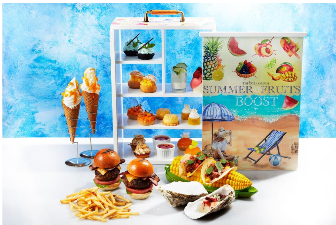
「サマーフルーツ・アフタヌーンティー・ブースト」(写真は2名盛)

お飲み物は、ウェルカムドリンクとしてクランベリージュースとジャスミンティーを使ったモクテル「Tokyo Bay Breeze(トウキョウ・ベイブリーズ)」をサービスした後、各種紅茶やフレーバーティー、コーヒーなど全 9 種類の飲み物がフリードリンクとなります。ランチや午後のくつろぎのひとつときに、夏らしさを満喫できる「サマーフルーツ・アフタヌーンティー・ブースト」の概要は次頁のとおりです。