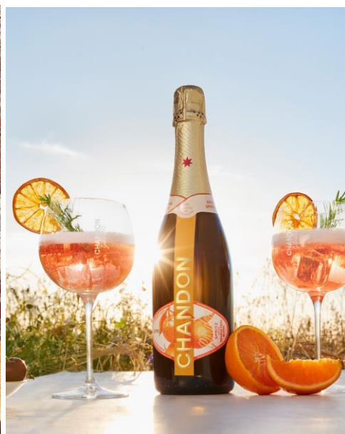
「シャンドン ガーデン スプリッツ」

同店では、同じく8月1日より、クラフトビールと選べるデザートセットにした「スマッシュバーガーセット」や、2~3名様でシェアできる「メキシカントマホーク」「スペイン産ラムショルダーの煮込み」などの新メニューを提供しています。店内は4つのゾーニングで雰囲気が異なるインテリアになっており、天窗のある開放的な空間をはじめ、個室(室料無料)も充実していますので、お食事の目的や気分に合わせてお席が選べる楽しさがあります。涼しく快適な場所でバーベキューを楽しむような感覚を味わうことができる「シェアグリルプレート」の概要は次頁のとおりです。