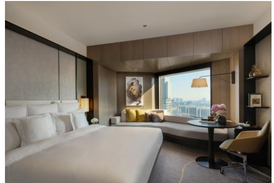
「金継ぎ」を内装デザインのモチーフにした客室(32～35階)

ANAインターコンチネンタルホテル東京【地上 37 階／客室数 844 室／12 のレストラン&バー／大小 22 の宴会場】は、赤坂・六本木・霞が関まで各徒歩圏内という東京の中心部に立地し、周辺には中央官庁、各国大使館、内外の一流企業など、国際的な政治経済の中核機能が集結しています。ビジネスとレジャーの両拠点として機能するロケーションの良さが内外のお客様から評価されています。