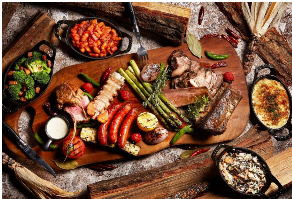
「シェアグリルプレート」(イメージ)

また、同メニューをご利用いただく場合のドリンクメニューのオプションとして、見た目にもエレガントなスパークリングワイン「シャンドン ガーデン スプリッツ」をご用意し、17時から19時の間は「ハッピーアワー」として、グラスでご注文の方は1杯の料分で2杯、ボトルでご注文の方も1本の料分で2本を提供する特典を設けましたので、特に女子会などのグループでのご利用にお奨めです。