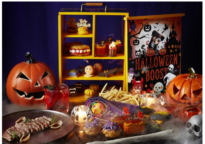
ザ・ステーキハウスの「ハロウィン・アフタヌーンティー・ブースト」(木箱:ファニーアニメ) ※写真はいずれも2名盛

2つ目は、備長炭炭火焼きを特徴とするアメリカンスタイルのステーキ専門店「ザ・ステーキハウス」で提供する「ハロウィン・アフタヌーンティー・ブースト」です。メニュー内容は、モンスターやミイラ、コウモリなどをモチーフにした、ユーモラスなスイーツ10品とセイボリー6品を揃えます。「楽しみながらパワーを促進(ブースト)する」というコンセプトのとおり、同店自慢のサーロインステーキやジューシーで香ばしいパテに定評のある和牛ハンバーガーなど、ボリューム感のある肉料理が含まれる点が特長です。盛り付けに使用する木箱は、ユニークで可愛いキャラクターを描いた「ファニーアニメ」[お1人様 7,250円(税・サービス料込み)]と、ゴーストタウンと化した東京をイメージした「ポストアポカリプス」[ハロウィンカクテル付き。お1人様 7,750円(税・サービス料込み)/写真・次頁]の2種類からお好みのデザインをお選びいただけます。また、お飲み物は、「ロンネフェルト」の各種紅茶やフレーバーティー、コーヒーなど全10種類がフリードリンクとなります。