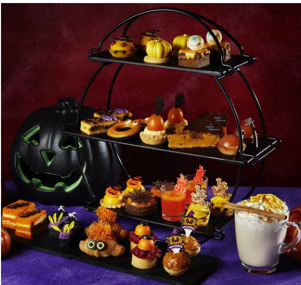
MIXX バー&ラウンジの 「ハロウィン・アフタヌーンティー・イン・ザ・スカイ」

魔女やお化けの仮装をし、“トリック・オア・トリート！(お菓子をくれないと悪戯するぞ！)”と街を練り歩く基督教のお祭り「ハロウィン」をテーマにしたアフタヌーンティーの人气が年々増している中、今年提供する1つ目は、36階からの都心の絶景が楽しめる「MIXX(ミックス) バー&ラウンジ」にて初登場する「ハロウィン・アフタヌーンティー・イン・ザ・スカイ」[お1人様 8,250円(税・サービス料込み)]です。メニュー内容には、カボチャやニンジン、オレンジ、アプリコット、金柑など、様々なオレンジ色の食材を使ったスイーツ12品とセイボリー(塩味の軽食)5品を揃えます。腕が突き出たタルトや、きよろきよろとした目玉が可愛いミニクワッサンなど、ハロウィンらしい遊び心溢れる演出が目を楽しませるほか、中央に干し柿を忍ばせた「完熟柿ゼリーとフィナンシェケーキ」や、マロンコンポートを加えてしっとり焼き上げた「パンプキンマロンタルト」など、秋の味覚も織り交ぜています。お飲み物は、ドイツの老舗紅茶メーカー「ロンネフェルト」の各種紅茶やフレーバーティー、コーヒー、日本茶など全16種類がフリードリンクとなります。また、オプションとして「スパイシー・パンプキン・ラテ」やシャンパンもご用意し、高層階からの眺望とともに、優雅なアフタヌーンティーのひとつをお過ごしいただけます。