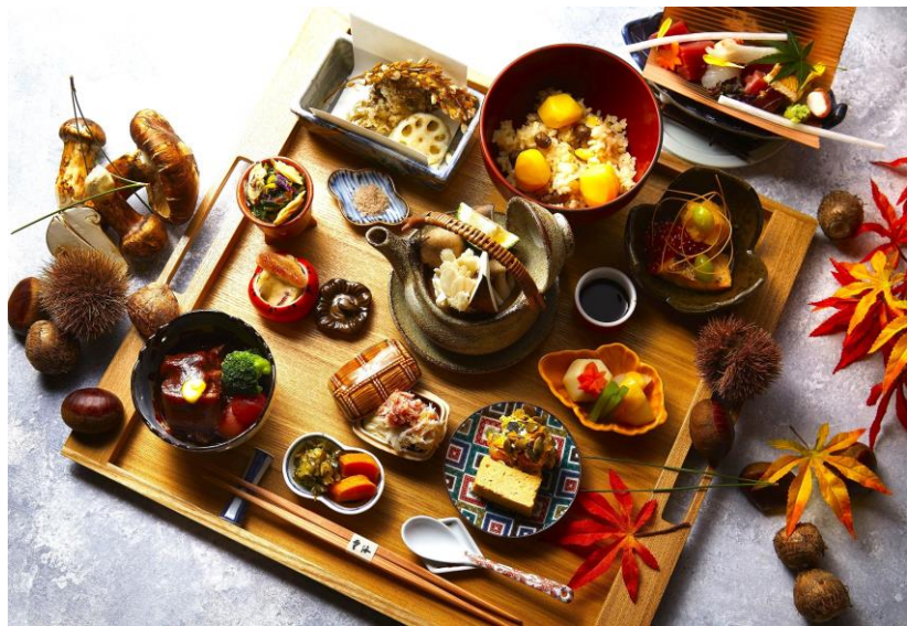
白木の角盆にのせて1度にテーブルサービスされる『彩り膳』(秋の献立の一例)

『彩り膳&和スイーツbuffet』は、旬の食材の香りの豊かさや食感を生かした一品一品を、風情のある器に個々に盛りつけ、白木の角盆に並べた彩り豊かな料理となっております。秋の献立では、食材の代表格である松茸や様々なキノコ類、栗、秋茄子、南瓜、銀杏、里芋、蓮根など、多種類の厳選した食材を使用し、料理長が素材の組み合わせに吟味を重ね、伝統的な技法を用いて丁寧に作り上げています。さらには、「完熟柿ゼリーとフィナンシェケーキ」「栗と胡桃のタルト」「雲海自家製水羊羹」「胡麻ぷりん」など、「雲海」料理長とパティシエが紡ぎ出す和洋テイストのスイーツをbuffet形式でお好きなだけ満喫できる点が特長です。