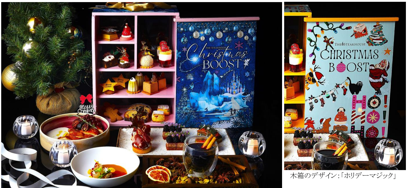
「クリスマス・アフタヌーンティー・ブースト」 木箱のデザイン:「ブルーアイスワンダーランド」 ※写真は 2 名盛

「クリスマス・アフタヌーンティー・ブースト」は、「ブルーアイスワンダーランド」と「ホリデーマジック」の 2 種類のオリジナルボックスから選ぶことができ、「ザ・ステーキハウス」独自のスタイルでテーブルサービスする点が特徴です。ボックスの中には、マジパンを忍ばせたシュトーレンや、アーモンドとヘーゼルナッツのプラリネのムースをキューブ状にし、トナカイを象ったチョコレートオーナメントで仕上げたケーキ、ルビーチョコレートとホイップクリームでサンタの帽子を愛らしく表現したガナッシュなど、クリスマスをモチーフに精巧に仕上げた味わい深い 12 種類のスイーツが並びます。また、別皿で提供する 5 種類のセイボリー(塩味のメニュー)は、赤スグリのあしらいとベシヤメルソースがクリスマスカラーを演出する本格ローストチキンをはじめ、ロブスターのビスクや、パン・デピスとブルーベリーで味わうパテ・ド・カンパーニュなど、フレンチテイストのお洒落感のある料理が含まれ、パーティーメニューとしても適しています。なお、12 月以降は、「ストロベリークリスマスブディング」や「ヴェリーヌストロベリーショートケーキ」など、内容の一部(計 5 品)をストロベリースイーツに変えてご提供します。お飲み物については、ドイツの老舗紅茶メーカー「ロンネフェルト」の各種紅茶やハーブティー、フレーバーティー、コーヒーなど全 10 種類をフリードリンクでお楽しみいただけます。