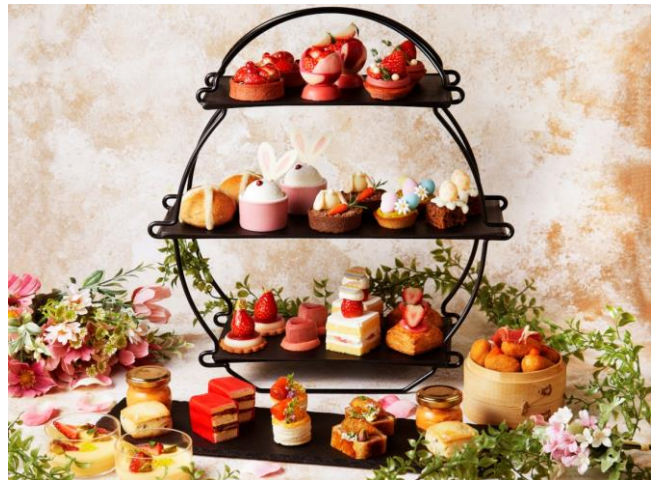
4月:「ストロベリー&イースター」 ※写真は2名盛

別皿で提供するセイボリー(塩味の軽食)には、「トウモロコシのフラン ストロベリーとピスタチオ」や「パテ・アン・クルート オレンジチャツネ添え」など、見た目にも華やかな6品の料理を揃えます。お飲み物は、ドイツの老舗紅茶メーカー「ロンネフェルト」の各種紅茶やフレーバーティー、コーヒー、日本茶など全15種類がフリードリンクで心ゆくまでお楽しみいただけます。さらに、3月は「いちごバージンモヒート」、4月は「ストロベリーティーソーダ」のスペシャルドリンクが付いたセットもご用意します。(写真・次頁)