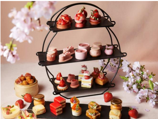
3月:「ストロベリー&さくら」 ※写真は2名盛

また、1段目と3段目に並ぶ7品は、フレッシュストロベリーと赤スグリをたっぷりと盛り付けた「ストロベリーとルバーブのタルト」やストロベリーフィナンシェと合わせた「ストロベリーとルビーチョコレートのガナッシュ」など、甘酸っぱく、瑞々しい味わいのイチゴを使用した全期間共通のストロベリースイーツとなります。