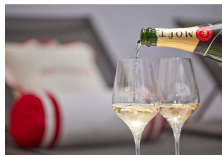
↑シャンパン「モエ アンペリアル」