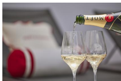
シャンパン「モエ アンペリアル」