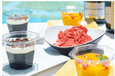
コーヒーゼリー ホイップクリーム添え (左)、 ふわふわかき氷 (中央)、 マンゴープディング 角切りマンゴー添え (右)

※上記のメニュー価格は、消費税・サービス料込み。 ※都合により、メニューは変更になる場合があります。