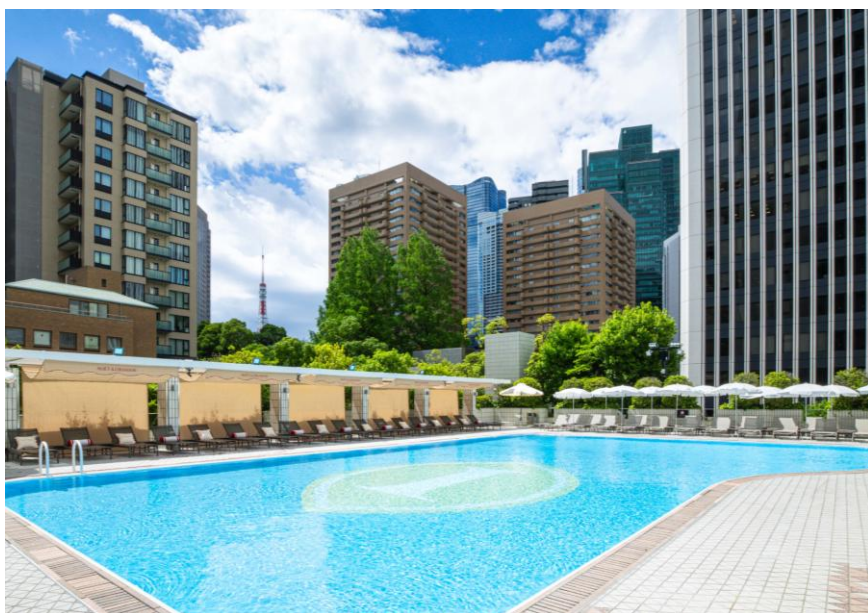
緑に囲まれた都会のオアシス「ガーデンプール」(2026年5月29日撮影)

今年も、フランスのシャンパンメゾン「モエ・エ・シャンドン」とのコラボレーションにより、白と赤を基調とした特製デザインのオーニング(日よけ)やパラソル、クッションを配した、フレンチシックな空間を演出します。さらに、今年からプールサイドの一部をウッドデッキ調にリニューアルし(写真・次頁)、よりリラックス感のある空間に仕上げました。青空の下、プールサイドでシャンパンを嗜む贅沢なひとときをお過ごしいただけます。夕暮れ時には、正面に見える東京タワーが点灯し、プールサイドや水中にもライトアップが加わることで、青と白のコントラストが美しい、涼やかで幻想的なナイトプールへと表情を変えます。