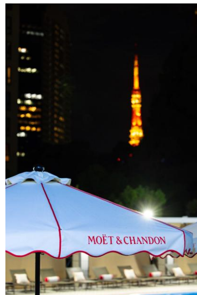
東京タワーを眺める絶好のロケーション