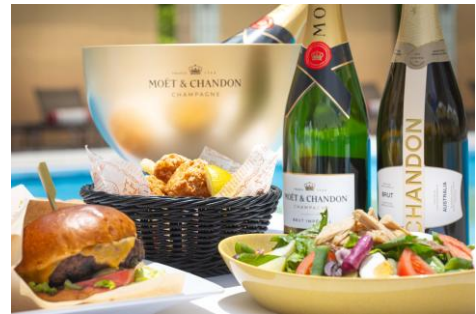
ザ・ステークハウスバーガー (左)、 チキンバスケット (中央)、サラダニソワーズ (右)