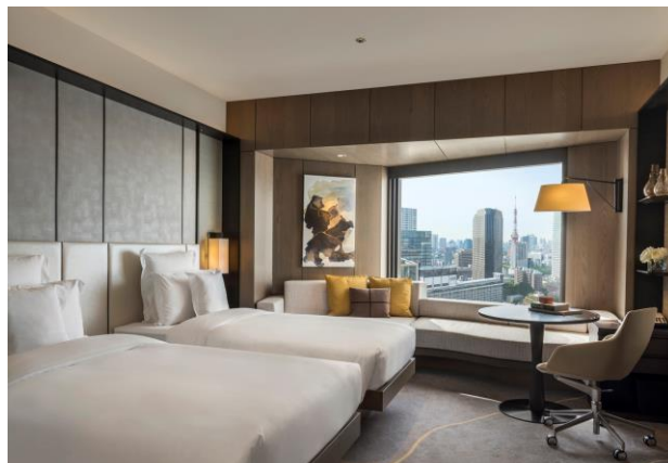
「金継ぎ」を内装デザインのモチーフにした クラブインターコンチネンタルルーム

ANA インターコンチネンタルホテル東京【地上 37 階／客室数 844 室／12 のレストラン&バー／大小 22 の宴会場】は、赤坂・六本木・霞が関まで各徒歩圏内という東京の中心部に立地し、周辺には中央官庁、各国大公使館、内外の一流企業など、国際的な政治経済の中核機能が集結しています。ビジネスとレジャーの両拠点として機能するロケーションの良さが内外のお客様から評価されています。