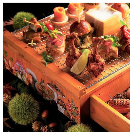
森の動物たちが山の恵みを頼るイラストを描いたオリジナルの木箱

メニュー内容は、トリュフ風味のマヨネーズとブリーチーズを合わせた炭火焼ミニバーガーや、自家製のスモークベーコンでマロングラッセを巻いたピンチョス、オニオンピクルスとともにチャバタ（イタリアの白パン）にのせて味わう自家製ポークリエットなど 10 種類のセイボリーに、「モンブラン」「洋梨のパート・ド・フリュイとクッキー」「ブドウのミニタルト」など 7 種類のスイーツを組み合わせたボリューム満点のメニューとなっています。同メニューのために、森の動物たちが描かれたイラストが印象的な引き出し付きの木箱をオリジナルで製作し、テーブルにサービスする際のサプライズ感を演出します。お飲み物は、各種紅茶やコーヒー、フレーバーティーのほかノンアルコールカクテルを含む全 15 種類から選べるフリードリンクスタイルです。追加のオプションとして、コエドビール 4 種セットや「フェンティマンス」のボタニカルドリンク 4 種セットなどもご用意しています。ランチや午後のくつろぎのひとつときに適した新メニュー「フォレスト・ブースト」の概要は次頁のとおりです。